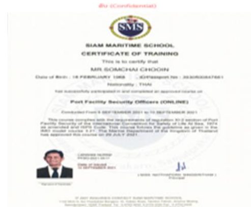
รูปที่ 2-26 การอบรมด้านความปลอดภัย