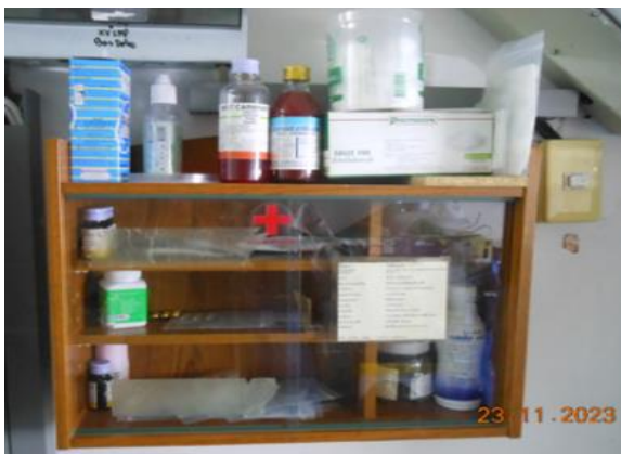
รูปที่ 2-21 การบริการด้านการรักษาพยาบาล