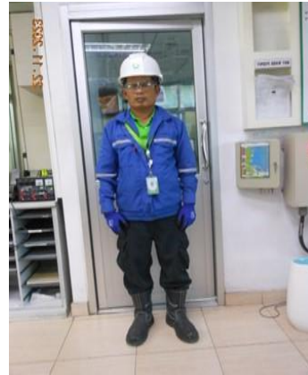
รูปที่ 2-20 อุปกรณ์คุ้มครองความปลอดภัยส่วนบุคคล (PPE)