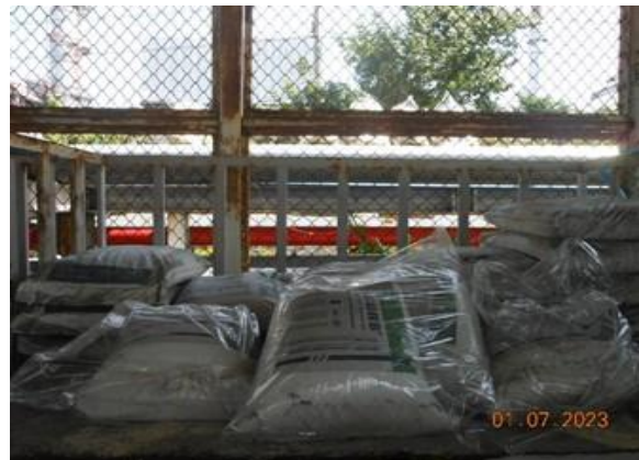
รูปที่ 2-6 ทรายสำหรับดูดซับน้ำมัน