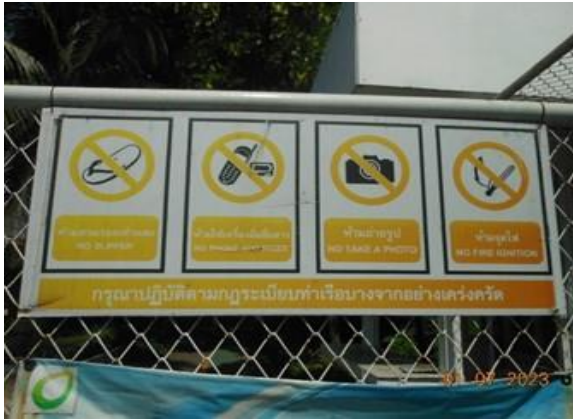
รูปที่ 2-19 ป้ายเตือน และป้ายแสดงข้อควรปฏิบัติ ก่อนเข้าพื้นที่ปฏิบัติงาน บริเวณลานจ่ายและท่าเทียบเรือ