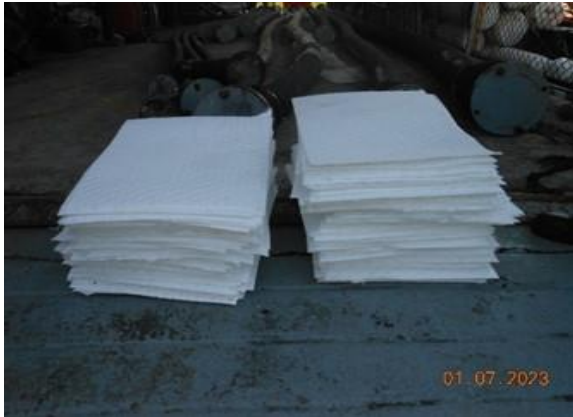
รูปที่ 2-7 วัสดุสำหรับดูดซับน้ำมัน