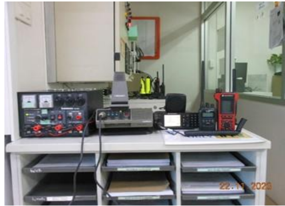
รูปที่ 2-14 เครื่องมือติดต่อสื่อสารระหว่างเรือและท่าเรือ