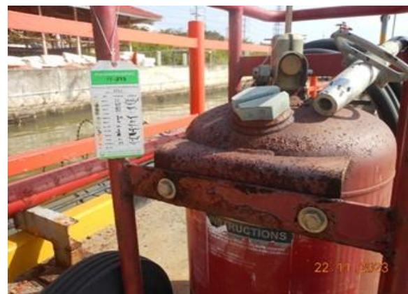
รูปที่ 2-28 การตรวจเช็คอุปกรณ์ดับเพลิงแบบติดล้อ บริเวณหน้าท่าเทียบเรือ