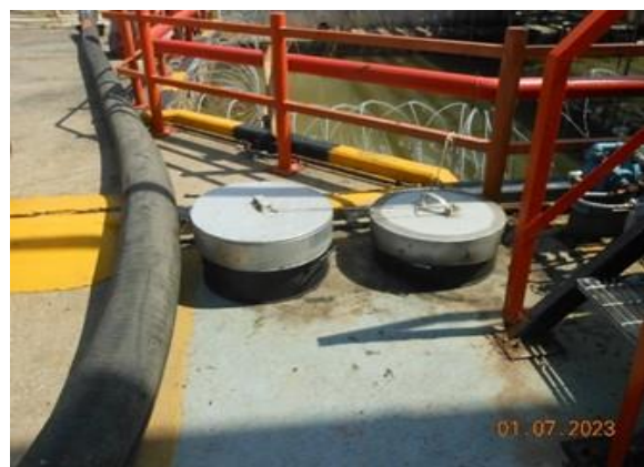
รูปที่ 2-12 ภาชนะรองรับน้ำมัน สำหรับรองรับบริเวณท่อรับ-จ่ายน้ำมัน