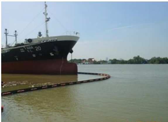
รูปที่ 2-5 ทุ่นกักน้ำมัน (Boom) อุปกรณ์ป้องกันการแพร่กระจายกรณีเกิดการหกรั่วไหล