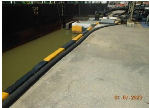
รูปที่ 2-2 คั่น Curb บริเวณขอบ Platform ของท่าเทียบเรือ