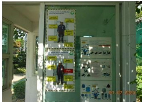
รูปที่ 2-18 ระเบียบการแต่งกายก่อนเข้าพื้นที่ ปฏิบัติงาน บริเวณลานจ่ายและท่าเทียบเรือ