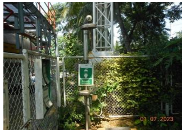
รูปที่ 2-22 จุดล้างตา และชำระร่างกายฉุกเฉิน