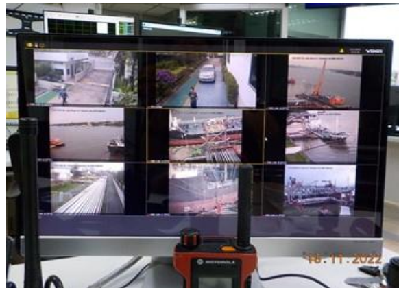
รูปที่ 2-16 กล้องวงจรปิดเพื่อความปลอดภัยขณะเรือ เข้า-ออกท่า