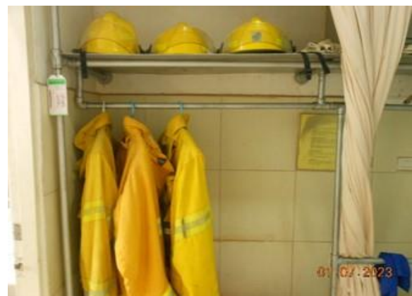
รูปที่ 2-24 อุปกรณ์สำหรับสวมใส่ กรณีระงับเหตุฉุกเฉิน