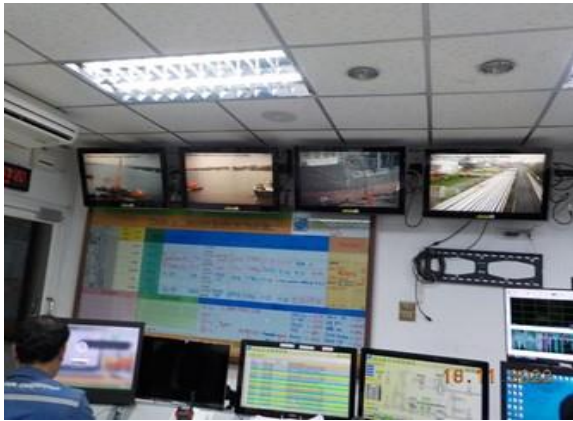
รูปที่ 2-13 ห้องควบคุมการทำงานของท่าเทียบเรือ