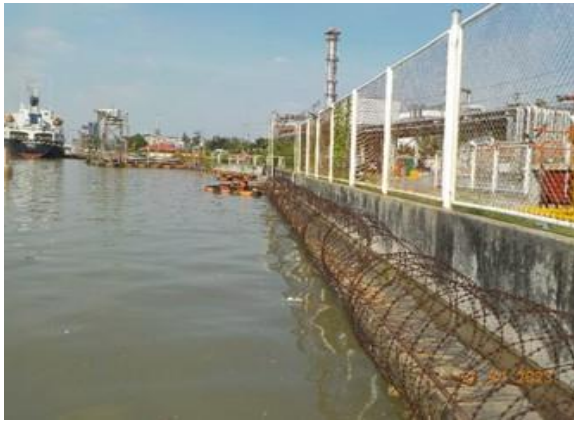
รูปที่ 2-1 เชื้อนคอนกรีตตลอดแนวท่าเทียบเรือ