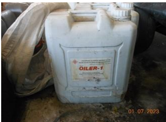
รูปที่ 2-9 ถังบรรจุสารเคมีขจัดคราบน้ำมัน (Oil dispersant)