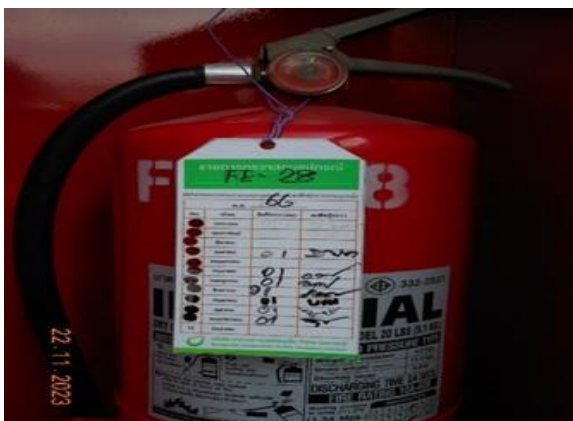
รูปที่ 2-27 การตรวจเช็คอุปกรณ์ดับเพลิงแบบมือถือ บริเวณหน้าท่าเทียบเรือ