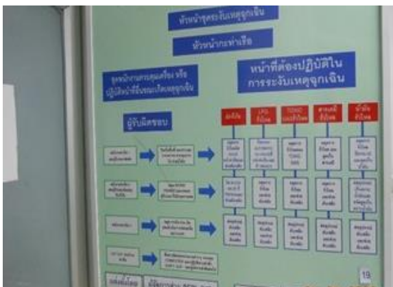
รูปที่ 2-23 บอร์ดแสดงทีมผู้ปฏิบัติหน้าที่ระงับเหตุฉุกเฉิน