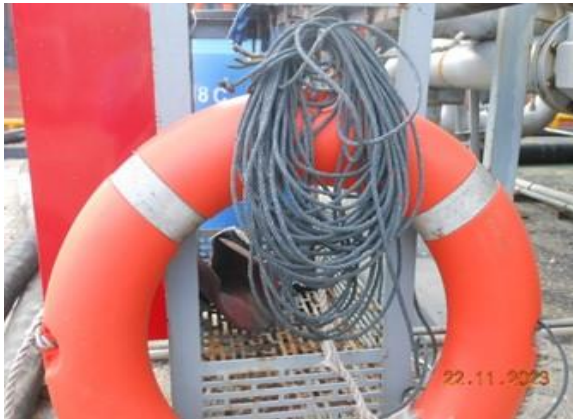
รูปที่ 2-25 อุปกรณ์ช่วยชีวิต กรณีฉุกเฉิน