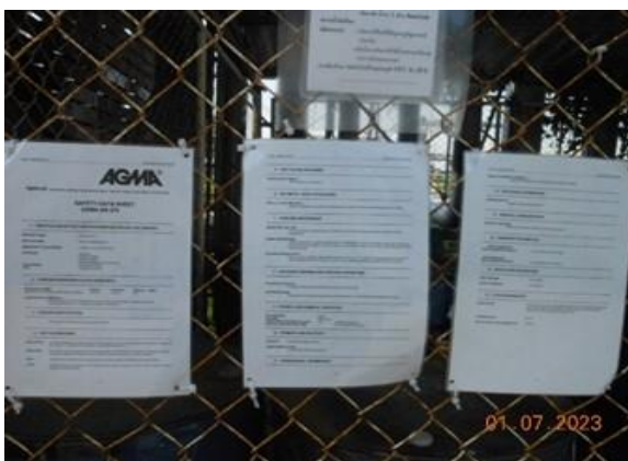
รูปที่ 2-11 เอกสารข้อมูลความปลอดภัยของสารเคมีขจัดคราบน้ำมัน (Oil dispersant)