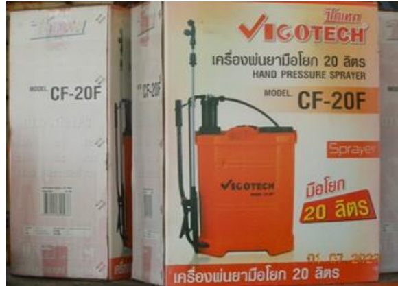
รูปที่ 2-8 อุปกรณ์สำหรับกำจัดคราบน้ำมัน กรณีเกิดการหกั่วไหล