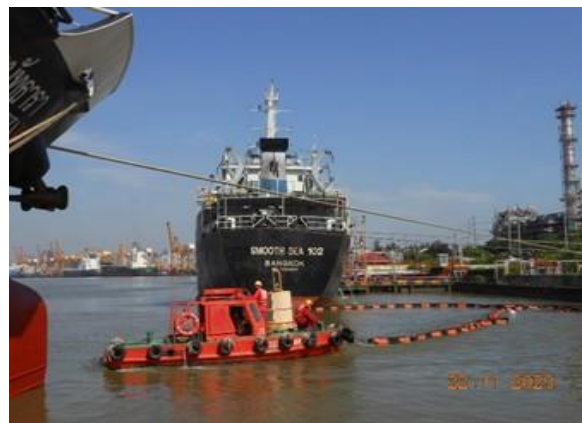
รูปที่ 2-4 เรือสนับสนุนสำหรับวาง-เก็บทุ่นกักน้ำมัน (Boom) เมื่อเรือเข้าเทียบท่า