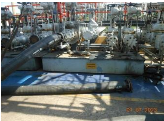
รูปที่ 2-3 Slop System สำหรับรองรับน้ำมันหกรั่วไหล