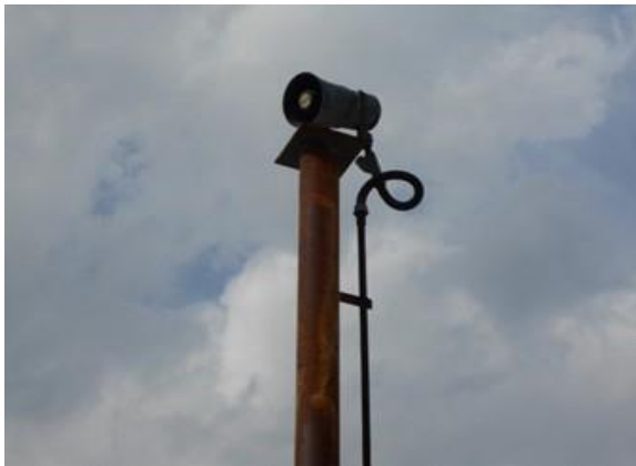
รูปที่ 2-15 ลำโพงกระจายเสียง